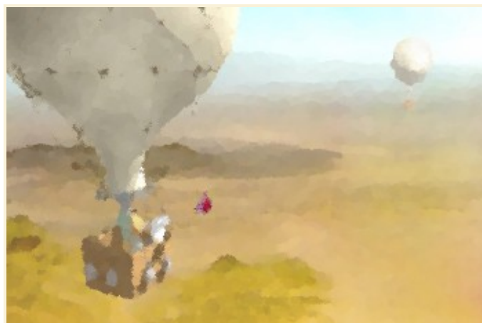
Filtros --> Artísticos --> Pintura al óleo