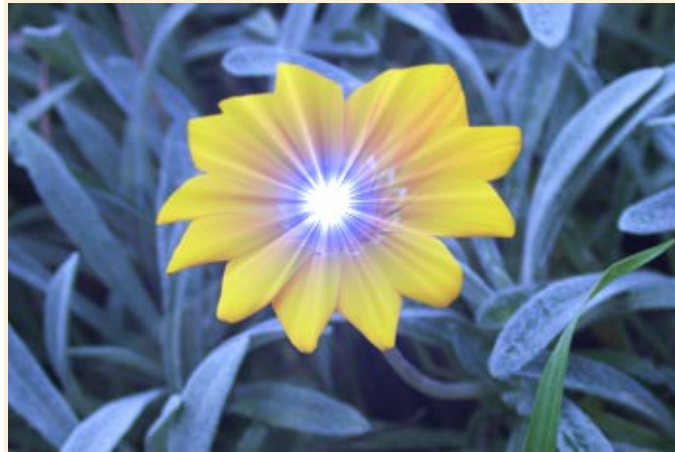
Filtros --> Luces y sombras--> Supernova