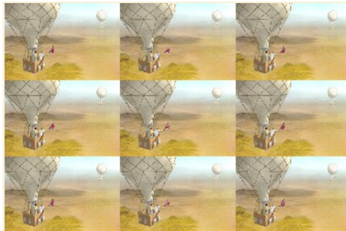
Filtros --> Mapa --> Baldosas pequeñas