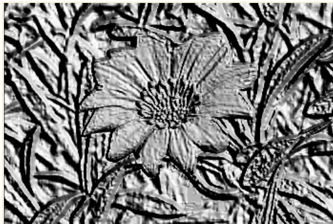
Filtros --> Distorsiones --> Repujado