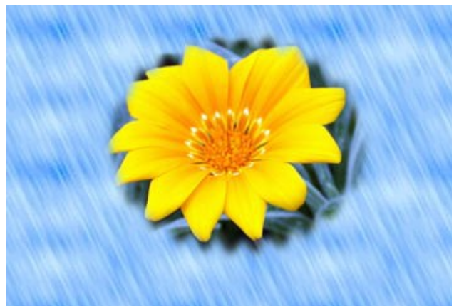
Filtro Distorsión-->Ondular, con Orientación vertical